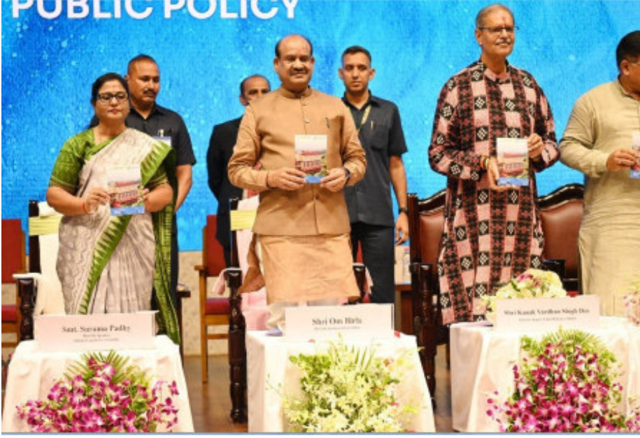
କିଟ୍ ସ୍କୁଲ୍ ଅଫ୍ ପବ୍ଲିକ୍ ପଲିସିର ଉଦ୍‌ଘାଟନ କରୁଥିବା ଉପସଭା ସଭ୍ୟ ଶ୍ରୀ ଓମ୍ ବିର୍ଲା (ଘାଟିଆ) ଓ ଅନ୍ୟ ଅତିଥିମାନଙ୍କ ସହିତ ।

ଭୁବନେଶ୍ୱର: ଲୋକସଭା ବାଚସ୍ପତି ଶ୍ରୀ ଓମ୍ ବିର୍ଲା ଆଜି ଭୁବନେଶ୍ୱର କଳିଙ୍ଗ ଇନ୍ଷ୍ଟିଚ୍ୟୁଟ୍ ଅଫ୍ ଇଣ୍ଡଷ୍ଟ୍ରିଆଲ୍ ଟେକ୍ନୋଲୋଜି (କିଟ୍) ବିଶ୍ୱବିଦ୍ୟାଳୟ ଠାରେ 'କିଟ୍ ସ୍କୁଲ୍ ଅଫ୍ ପବ୍ଲିକ୍ ପଲିସି'କୁ ଉଦ୍‌ଘାଟନ କରିଛନ୍ତି । କାର୍ଯ୍ୟକ୍ରମକୁ ସମୋ୍ଧ୍ୟତ କରି ଏପରି ଏକ ଶିକ୍ଷାନୁଷ୍ଠାନ ଖୋଲିଥିବାରୁ ସେ କର୍ତ୍ତୃପକ୍ଷଙ୍କୁ ଶୁଭେଚ୍ଛା ଜଣାଇଛନ୍ତି । ଏହି ଅବସରରେ ଶ୍ରୀ ବିର୍ଲା କହିଛନ୍ତି, ଯେକୌଣସି ସମାଜର ଗଠନ ଏବଂ ନାଗରିକଙ୍କ ଜୀବନକୁ ପ୍ରଭାବିତ କରିବାରେ 'ଲୋକ ନୀତି' ବା ପବ୍ଲିକ୍ ପଲିସିର ଗୁରୁତ୍ୱପୂର୍ଣ୍ଣ ଭୂମିକା ରହିଛି । ସମାଜର ଅଧିକାଂଶ ନାଗରିକ ନୀତି ନିର୍ଦ୍ଧାରଣରେ ଯୋଗଦାନ କରିବା ଉଚିତ୍ ବୋଲି ସେ ମତପ୍ରକାଶ କରିଛନ୍ତି ।